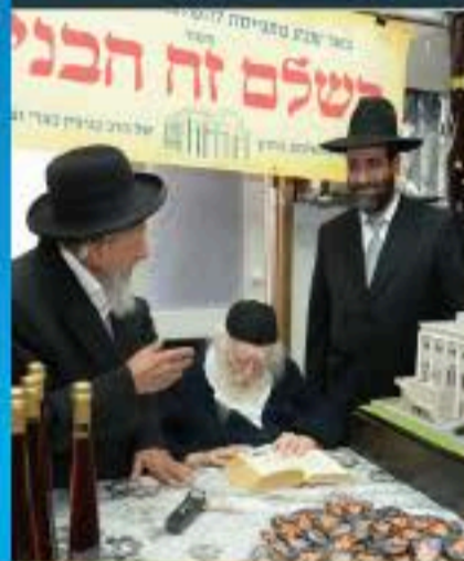
מנן שר התורה הגר"ח קנייבסקי מנן חכם שלום כהן הגאון הגדול רבי שמעון בעדני